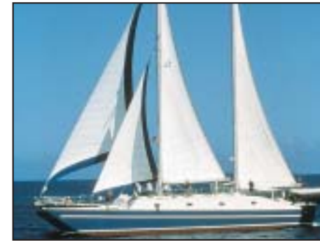
Galapagos Crociere e Tour in Equador