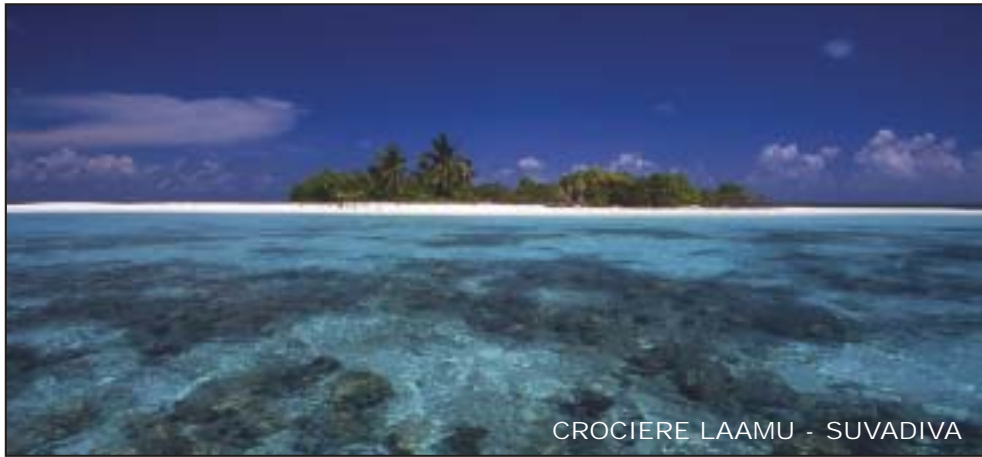
CROCIERE LAAMU - SUVADIVA

Le crociere negli atolli più meridionali delle Maldive sono una meta da sogno. Si naviga fra isole deserte ed incontaminate. Le immersioni, come lo snorkeling, sono in assoluto tra le più belle che l'arcipelago possa offrire con pass e reef ricchissimi di vita. Potrete scegliere la vostra crociera di una o due settimane includendo il tragitto che attraversa tutti gli atolli. Trasferimenti interni da Malè con voli dell'Island Aviation.