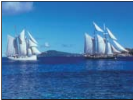
Seychelles Crociere e Resort