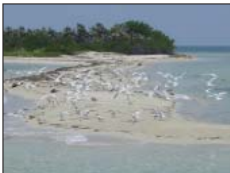
Cuba Crociere e Hotels