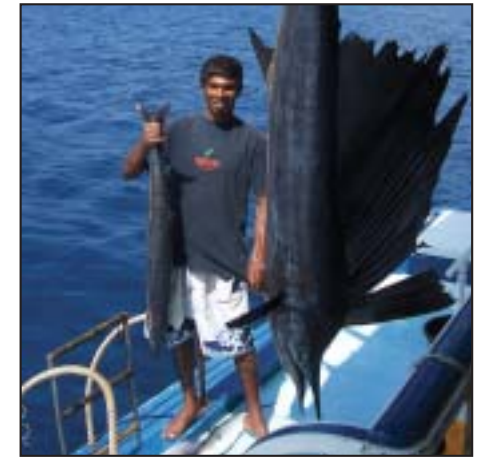
CROCIERE PER PESCATORI

Le crociere negli atolli più meridionali delle Maldive sono una meta da sogno. Si naviga fra isole deserte ed incontaminate. Le immersioni, come lo snorkeling, sono in assoluto tra le più belle che l'arcipelago possa offrire con pass e reef ricchissimi di vita. Potrete scegliere la vostra crociera di una o due settimane includendo il tragitto che attraversa tutti gli atolli. Trasferimenti interni da Malè con voli dell'Island Aviation.