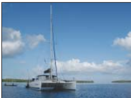
Zanzibar, Pemba, Mafia Crociere e Resort