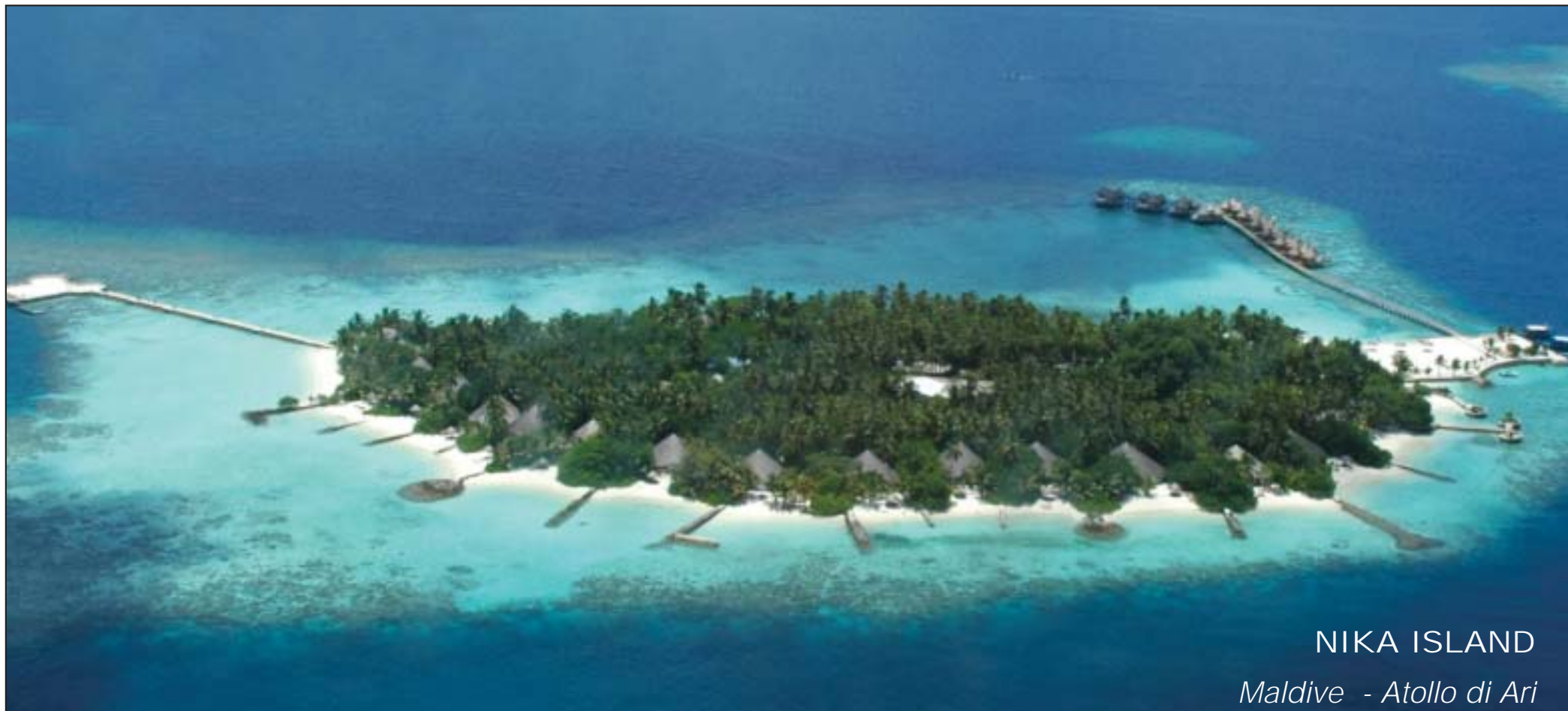
NIKA ISLAND Maldives - Atollo di Ari