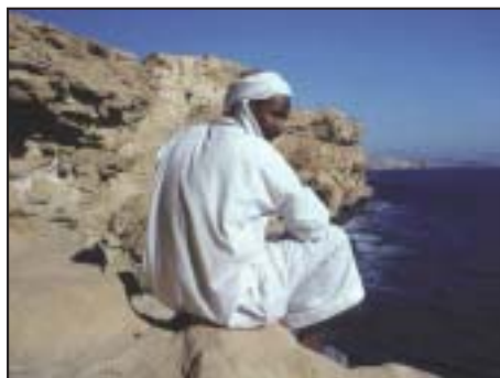
Egitto Crociere e Hotels