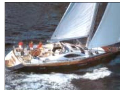
Around the world Grenada e altre barche