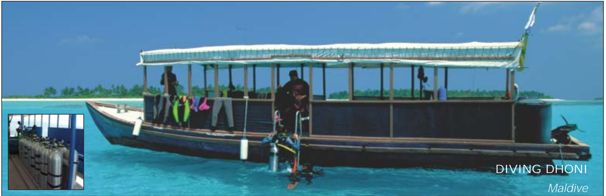
DIVING DHONI Maldive

Le Crociere Albatros Top Boat vi porteranno alla scoperta dell'arcipelago maldiviano lungo rotte esclusive e personalizzate regalandovi spettacoli naturali mozzafiato e luoghi incontaminati per esperienze indimenticabili.