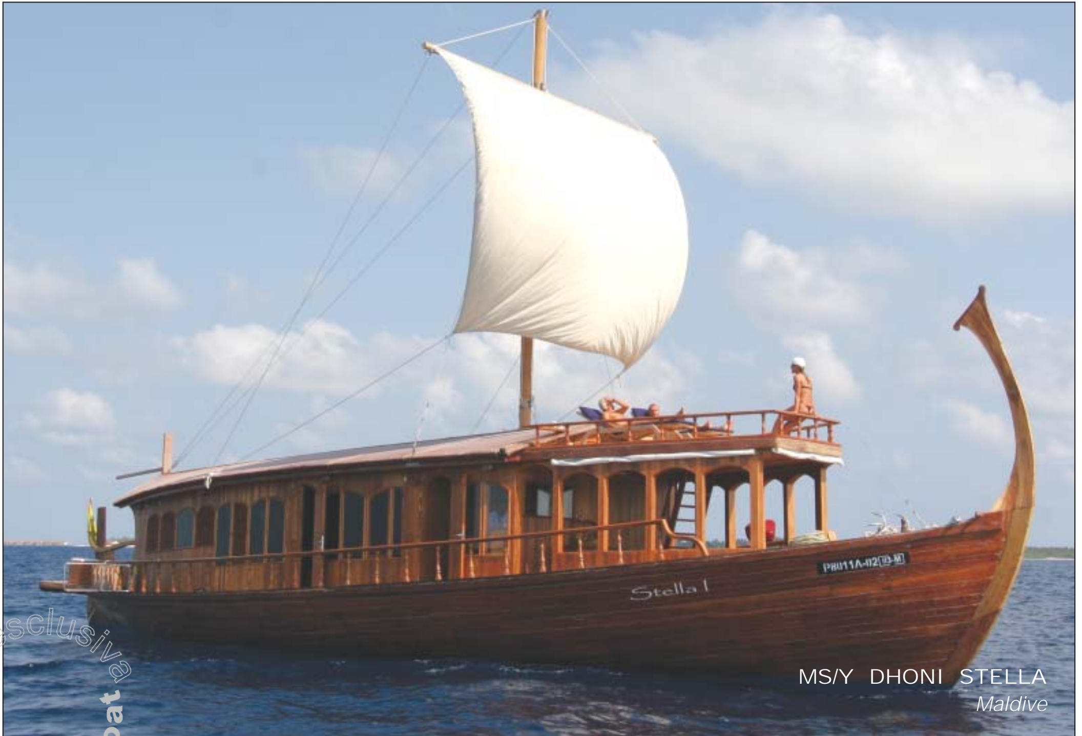
MS/Y DHONI STELLA Maldiv