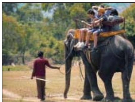
Sri Lanka Tour Eco-Benessere