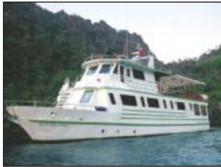
Thailandia e Myanmar Crociere