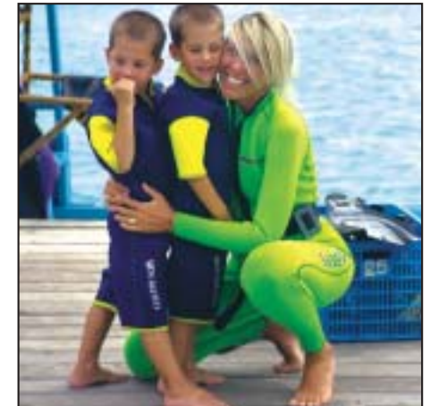
ALBATROS TOP BOAT PENSA ANCHE AI BAMBINI

Nel perfetto connubio fra vento e onde, nel periodo che va da marzo a ottobre, circondati dalla bellezza dello scenario che offrono le Maldive, Albatros Top Boat organizza crociere dedicate agli amanti del surf e del kitesurf. Una guida specializzata vi condurrà in tutti i migliori spot delle Maldive, compreso l'atollo di Suvadiva.